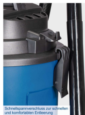
Schnellsparverschluss zur schnellen und komfortablen Entleerung